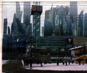
Overvåket. «Big Brother»-kameraer finnes over alt.

I filmens univers lever menneskene kun innenfor bykjerne, og får daglige oppdatert-